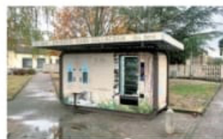
La Casa dell'acqua di Castello d'Agogna